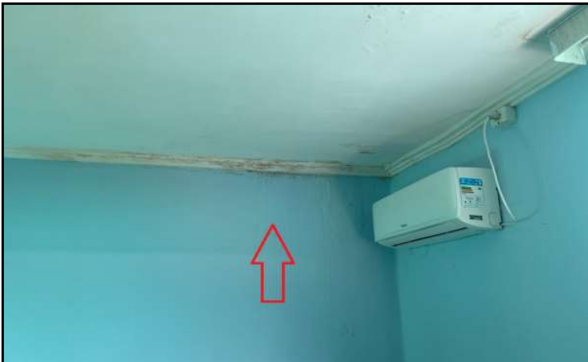
OBRA: CÂMARA MUNICIPAL DE CORUMBAÍBA DESTAQUE: MANCHAS NO FORRO E PAREDES AMBIENTE: SALA 04 (PAV. TÉRREO) Data: 17/07/2023 Foto: 13