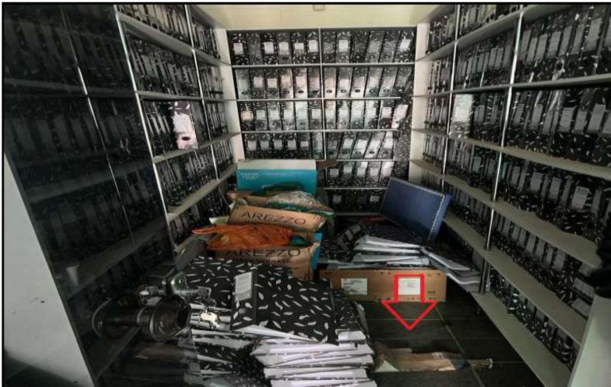
OBRA: CÂMARA MUNICIPAL DE CORUMBAÍBA DESTAQUE: PISO VELHO AMBIENTE: ARQUIVO 02 (PAV. TÉRREO) Data: 17/07/2023 Foto: 10