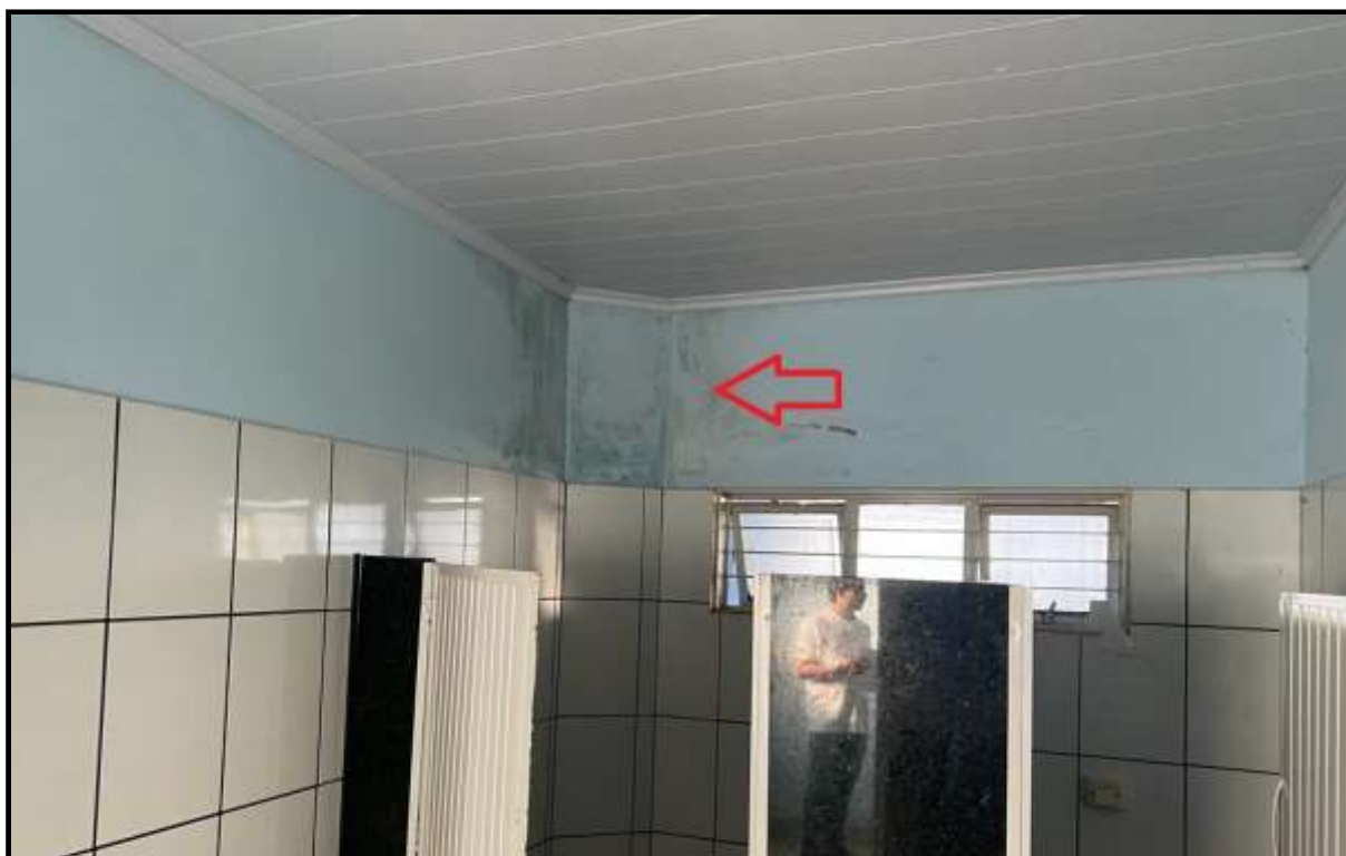
OBRA: CÂMARA MUNICIPAL DE CORUMBAÍBA DESTAQUE: MANCHA D`ÁGUA NA PAREDE AMBIENTE: WC MASCULINO (PAV. TÉRREO) Data: 17/07/2023 Foto: 07