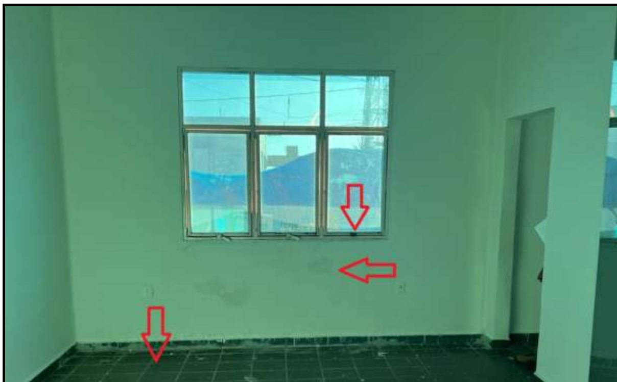
OBRA: CÂMARA MUNICIPAL DE CORUMBAÍBA DESTAQUE: AUSÊNCIA DE FECHADURA, ESPELHO DE TOMADAS, PINTURA DANIFCADA E PISO VELHO AMBIENTE: SALA 06 (PAV. TÉRREO) Data: 17/07/2023 Foto: 17