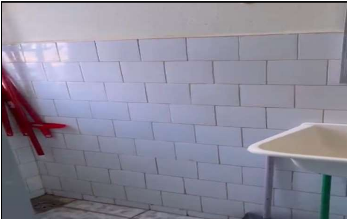
OBRA: CÂMARA MUNICIPAL DE CORUMBAÍBA DESTAQUE: REMOÇÃO DA PIA E PINTURA DAS PAREDES AMBIENTE: BANHEIRO SALA 02 (PAV. SUPERIOR) Data: 17/07/2023 Foto: 24