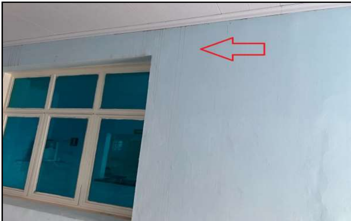
OBRA: CÂMARA MUNICIPAL DE CORUMBAÍBA DESTAQUE: MANCHA D`ÁGUA NA PAREDE AMBIENTE: CIRCULAÇÃO 04 (PAV. TÉRREO) Data: 17/07/2023 Foto: 05