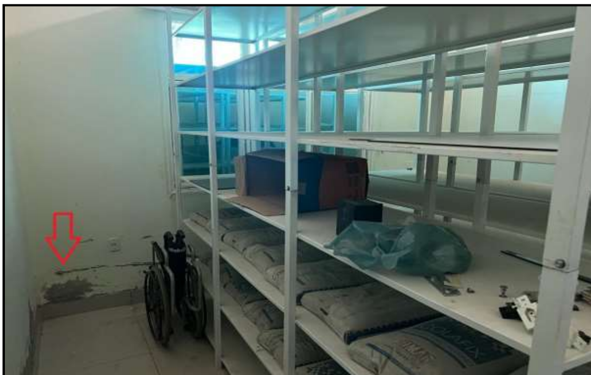
OBRA: CÂMARA MUNICIPAL DE CORUMBAÍBA DESTAQUE: PINTURA DANIFICADA AMBIENTE: SALA 02 (PAV. TÉRREO) Data: 17/07/2023 Foto: 09