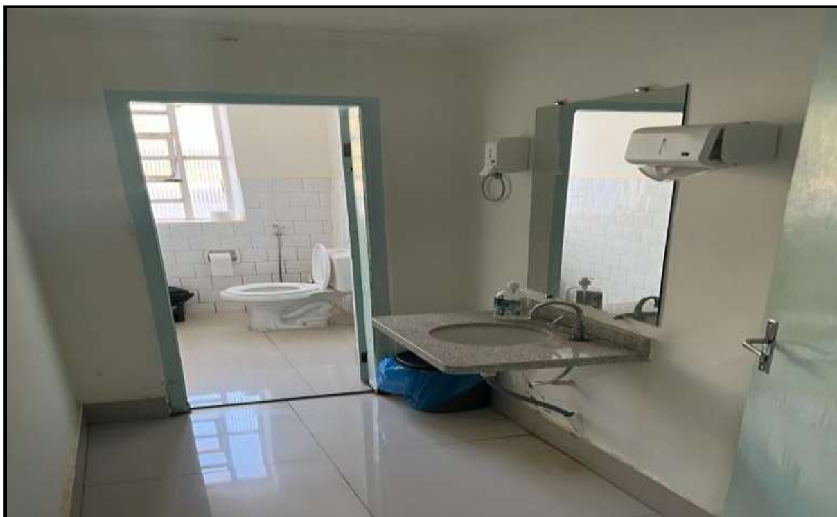
OBRA: CÂMARA MUNICIPAL DE CORUMBAÍBA DESTAQUE: PINTURA DAS PAREDES E PORTAS AMBIENTE: BANHEIRO FEMININO (PAV. SUPERIOR) Data: 17/07/2023 Foto: 25