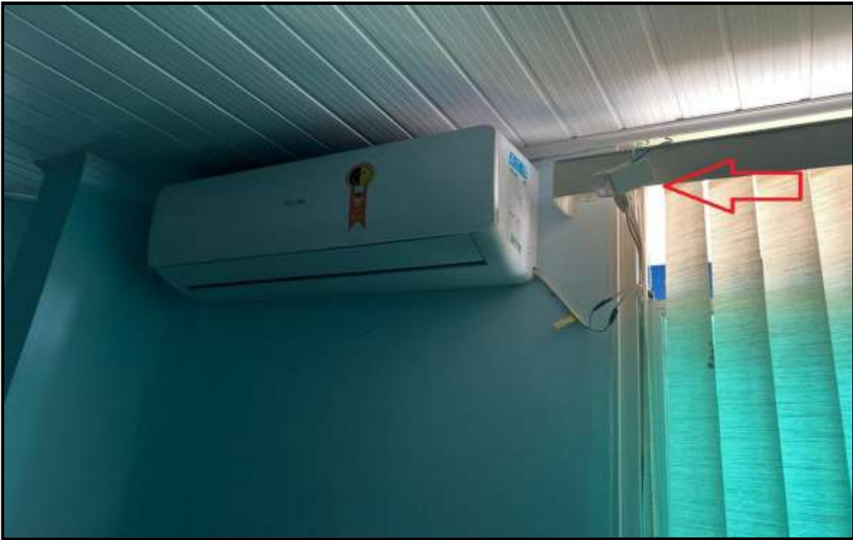
OBRA: CÂMARA MUNICIPAL DE CORUMBAÍBA DESTAQUE: SISTEMA ELÉTRICO EXPOSTO AMBIENTE: PLÊNARIO (PAV. SUPERIOR) Data: 17/07/2023 Foto: 22