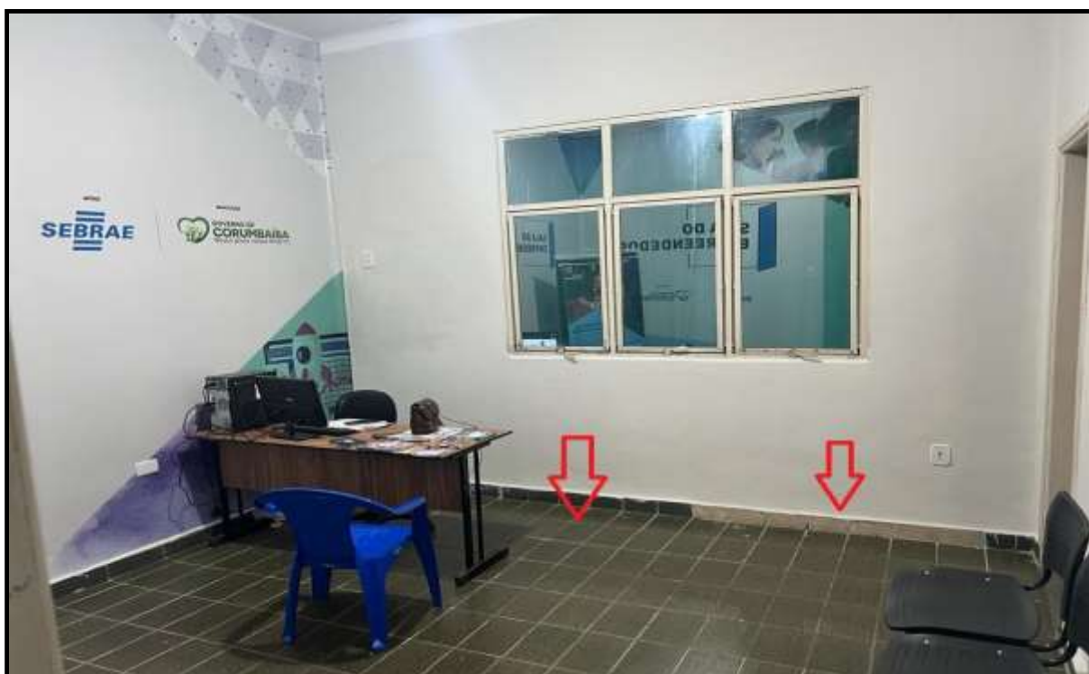
OBRA: CÂMARA MUNICIPAL DE CORUMBAÍBA DESTAQUE: AUSÊNCIA DE RODAPÉ/PISO VELHO AMBIENTE: SEBRAE 01 (PAV. TÉRREO) Data: 17/07/2023 Foto: 11