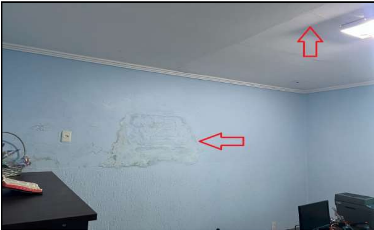
OBRA: CÂMARA MUNICIPAL DE CORUMBAÍBA DESTAQUE: FORRO GESSO DANIFICADO E MANCHA D'ÁGUA NA PAREDE AMBIENTE: SALA 02 - FINANCEIRO (PAV. SUPERIOR) Data: 17/07/2023 Foto: 23