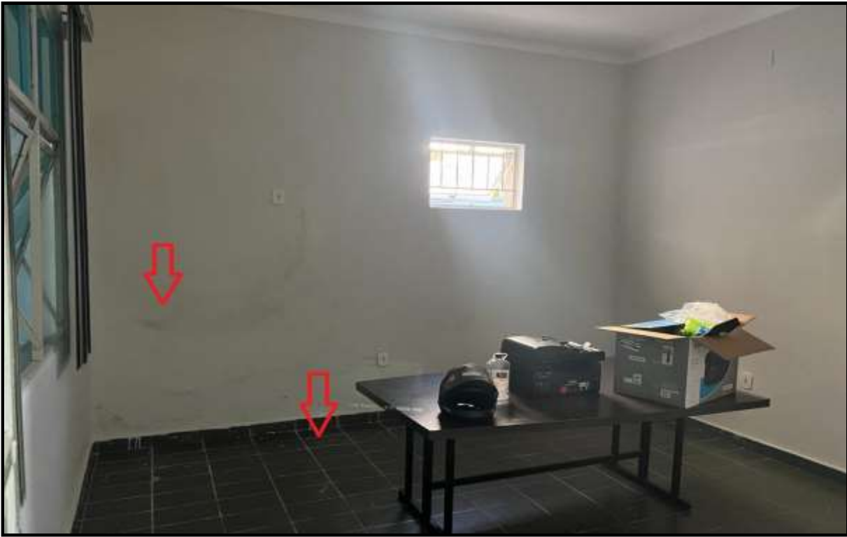
OBRA: CÂMARA MUNICIPAL DE CORUMBAÍBA DESTAQUE: PISO VELHO/PINTURA DAS PAREDES COM MANCHAS AMBIENTE: SEBRAE 02 (PAV. TÉRREO) Data: 17/07/2023 Foto: 12