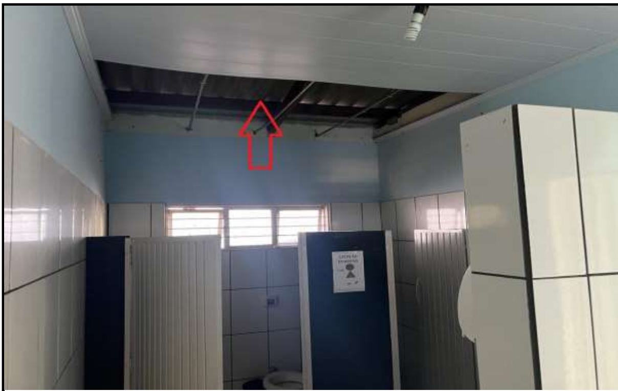
OBRA: CÂMARA MUNICIPAL DE CORUMBAÍBA DESTAQUE: FORRO DE PVC COM AUSÊNCIA DE PLACAS AMBIENTE: WC FEMININO (PAV. TÉRREO) Data: 17/07/2023 Foto: 06