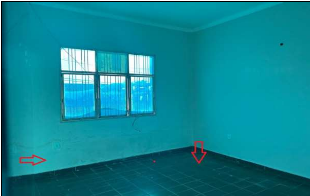
OBRA: CÂMARA MUNICIPAL DE CORUMBAÍBA DESTAQUE: PAREDES COM MANCHAS E PISO VELHO AMBIENTE: SALA 07 (PAV. TÉRREO) Data: 17/07/2023 Foto: 16