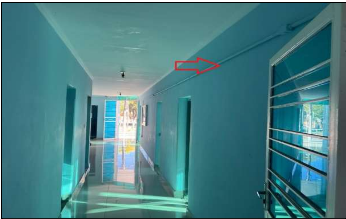
OBRA: CÂMARA MUNICIPAL DE CORUMBAÍBA DESTAQUE: REDE ÉLETRICA EXPOSTA AMBIENTE: CIRCULAÇÃO 02 (PAV. TÉRREO) Data: 17/07/2023 Foto: 04